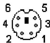
图 1-2. PS/2 引脚排列定义